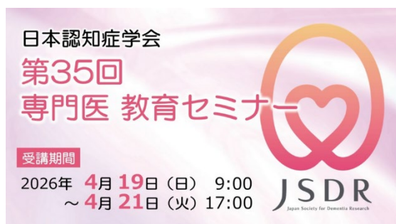
A. 通常受講用サムネイル