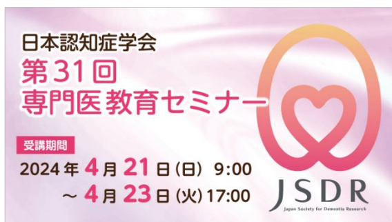
A. 通常受講用サムネイル